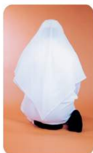
صور الجلوس للتشهد الأول