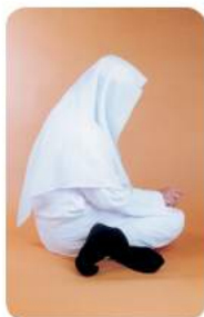
صور الجلوس للتشهد الأخير (التورك)